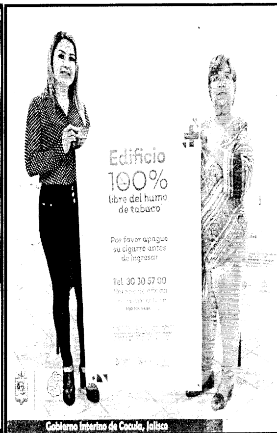
Gobierno Interino de Cocula, Jalisco